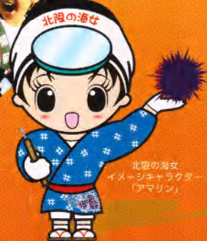
北沢の海女 イメージキャラクター 「アマリン」