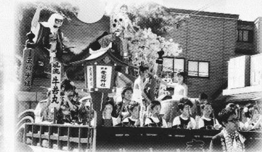
三社合同(上・中・下組)山車